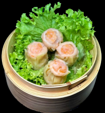
A23. Shrimps Shiu Mai a,g,h,l