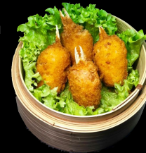
A29. Geb. Krebscheren a,g,h,l