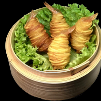
A27. Potato Shrimps a,g,h,l