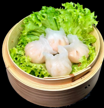
A21. Ha Gao a,g,h