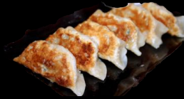
A26. Gebr. Maultasche a,h,j,l