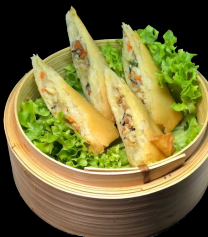
A31. Frühlingsrolle a,h,l