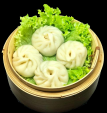
A25. Siu Long Pau a,h,j,l,o