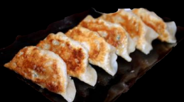
A26v. Gebr. Maultasche a,h,j,l