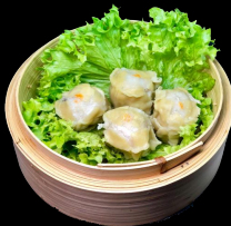
A22. Shiu Mai a,h,l,o