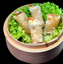
A30. Frühlingsrolle a,h,j,l